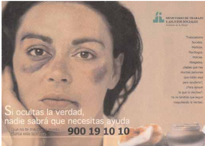
Campaña contra la violencia hacia las mujeres del Instituto de la Mujer

Sin embargo, con posterioridad al delito, la víctima puede sufrir nuevos daños de origen institucional, cuando recurre a los órganos encargados de perseguir el delito (Juzgados, Policía y Ministerio Fiscal) o a los Servicios Sociales y Sanitarios para paliar los efectos dañinos del hecho delictivo, y recibe una respuesta inadecuada, estigmatizadora o injusta por parte de dichas instancias. Todos los daños psíquicos, físicos, sociales o económicos generados a las víctimas a lo largo de este proceso, reciben el nombre de victimización secundaria .