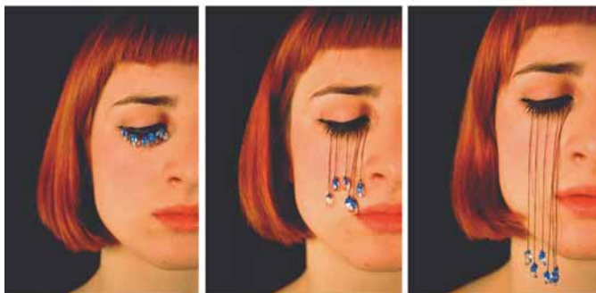
Composición titulada "Besos" de Soledad Córdoba

Estos procedimientos penales suelen ser archivados antes de llegar a fase de juicio, porque los hechos objeto de la denuncia no son constitutivos de delito o falta, o porque el Juez o la Jueza instructor llega a la convicción de que no han sucedido, pero sirven para desechar la hipótesis de que los hombres se avergüenzan de denunciar estas situaciones y que por eso no se conocen los verdaderos datos del maltrato masculino. Es más, expertas en la violencia psicológica como Hirigoyen, se refieren a que los acosadores morales en las relaciones afectivas se sirven de la ley como un instrumento para desestabilizar psicológicamente a las víctimas y restarles credibilidad ante la sociedad 13 .